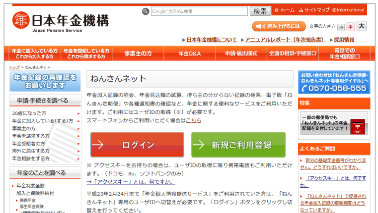
(日本年金機構ホームページ「ねんきんネット」)

ユーザーIDの取得が必要となりますが、年金加入記録の照会、年金見込額の試算、持ち主の分からない記録の検索、電子版「ねんきん定期便」や各種通知書の確認ができるようになります。利用登録やどのようなことができるかの詳細は以下の通りです。